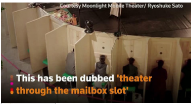
This has been dubbed 'theater through the mailbox slot'