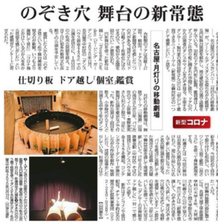
Journal Mainichi 02/02/2021