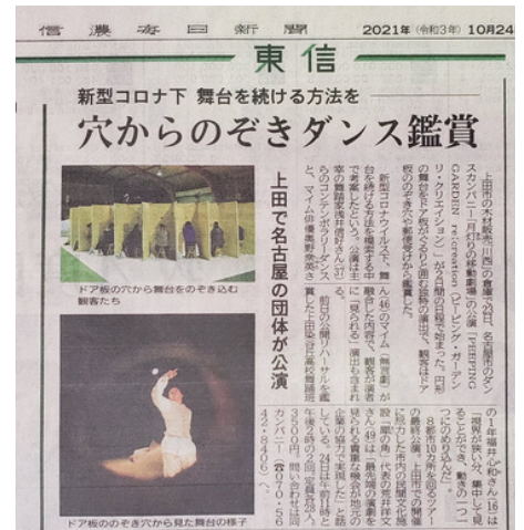
Journal Shinano 24/10/2021