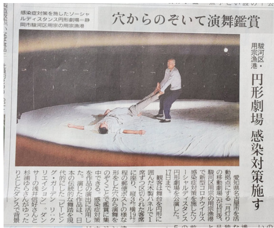
Journal Shizuoka 17/10/2021